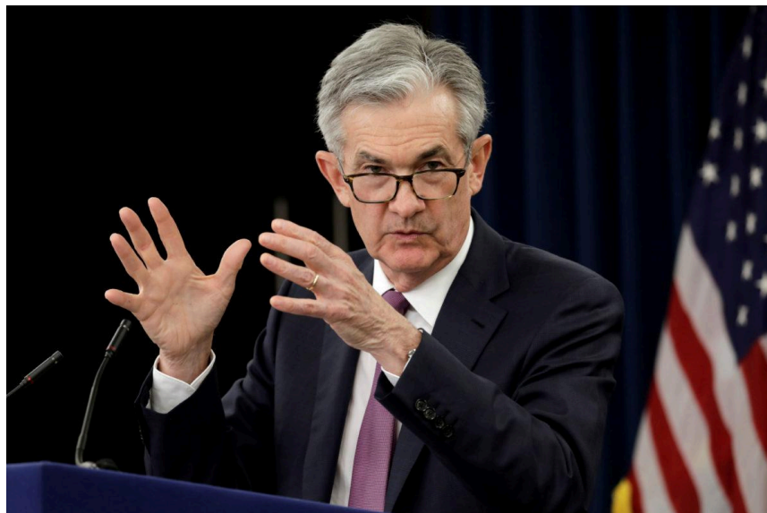
Jeremy Powell, ledaren av USA:s centralbank.

USA:s centralbank, Federal Reserve, pausade landets räntehöjningar och förutspås under 2024 sänka styrräntan. Detta kan betyda en vändpunkt för USA:s och världens lågkonjunktur. Centralbanken har höjt räntenivån elva gånger mellan mars 2022 och juli 2023 till den nuvarande nivå av 5,25-5,5%, den högsta nivå på 22 år. Sedan juli har centralbanken bestämt att lämna räntenivån orörd. Målet med höjningarna har varit att dämpa landets höga inflation genom att göra det dyrare att ta lån.