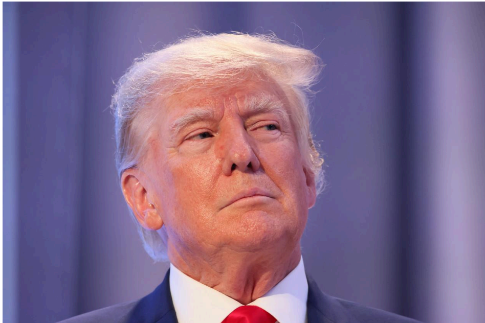
USA:s 45:e president, Donald Trump.

USAs tidigare president, Donald Trump, använde en ovanlig taktik för att vinna den republikanska nomineringen till presidentvalet. Under hela 2023 deltog han inte på någon av de stora debatterna. På så sätt undviker 77-årige Donald Trump kritiska frågor från hans utmanare, en taktik som verkar ha fungerat än så länge. Opinionssiffrorna är höga och han är favorittippad att vinna nomineringen. Om Donald Trump vinner nomineringen kommer han att ha stora chanser att vinna presidentvalet i november 2024 över 81-årige Joe Biden som lider av låga opinionssiffror. Det amerikanska presidentvalet är en av världens mest avgörande händelser nästa år, inte minst på grund av att USA engagemang i den Israel/Palestina-konflikten och kriget i Ukraina.