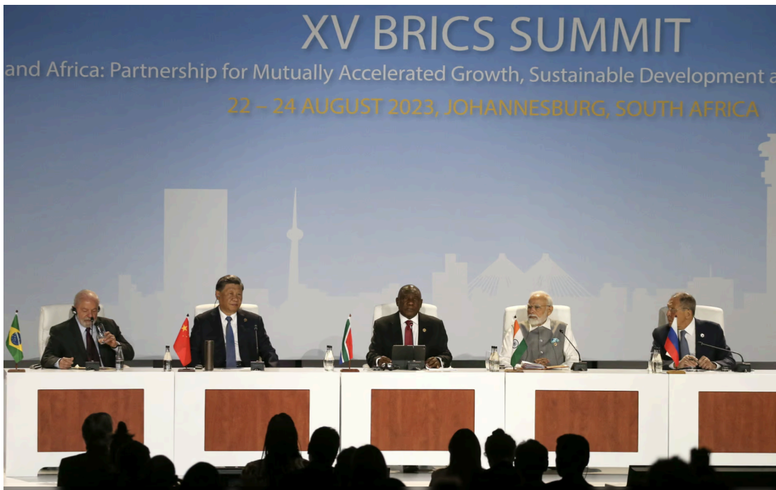
BRICS ledare samlade i Sydafrika. Rysslands president, Vladimir Putin, var inte närvarande på mötet efter en internationella arresteringsorder upprättats mot honom efter påstådda krigsbrott vid Rysslands invasion av Ukraina.

Den ekonomiska samarbetsorganisationen BRICS, vars medlemmar är Brasilien, Ryssland, Indien, Kina och Sydafrika, kommer att välkomna nya medlemsländer Iran, Saudi Arabien, Etiopien, Egypten och Förenade Arabemiraten till gruppen. BRICS länderna är betydelsefulla på grund av deras snabbväxande ekonomier, regionala påverkan på grannländer och olika politiska system.