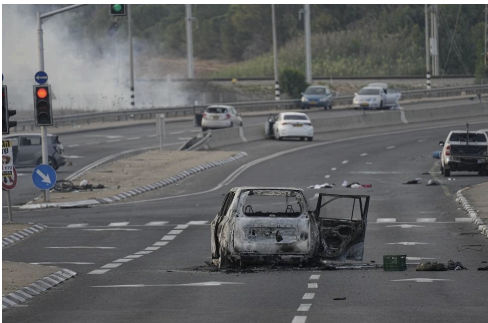
En motorväg i Sderot, Israel, efter Hamas attacken.